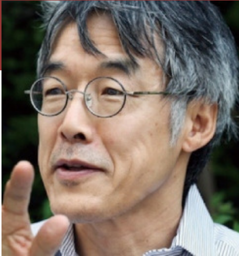
高橋 源一郎(たかはし げんいちろう)氏

1951年広島県尾道市に生まれる。作家。明治学院大学国際学部教授。1981年、『さようなら、ギャングたち』でデビュー、「群像」新人長編小説優秀賞受賞。88年、『優雅で感傷的な日本野球』で三島由紀夫賞受賞。2002年、『日本文学盛衰史』で伊藤整文学賞受賞。12年、『さよならクリストファー・ロビン』で谷崎潤一郎賞を受賞。他に『官能小説家』『君が代は千代に八千代に』など多数。