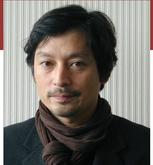
島田 雅彦(しまだ まさひこ)氏

1961年東京都に生まれる。作家。法政大学国際文化学部教授。84年東京外国語大学外国語学部ロシア語学科在学中に、『優しいサヨクのための嬉遊曲』でデビュー。92年、『彼岸先生』で泉鏡花文学賞を受賞。2006年、『退廃姉妹』で伊藤整文学賞を受賞。08年、『カオスの娘』で芸術選奨文部科学大臣賞受賞。他に『僕は模造人間』『自由死刑』『悪貨』『ニッチを探して』など多数。