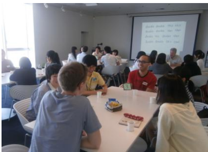
グループトークの様子