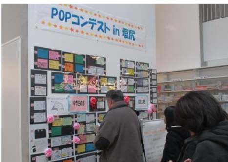
大盛況だったPOPコンテスト！！

連携をはじめ、市立図書館の世界がさらに広がったと思います。これからも、市立図書館は学校図書館と力を合わせて、皆さんが本を身近に感じる環境づくりとともっと楽しく役立つ図書館をつくっていくためにがんばります！！