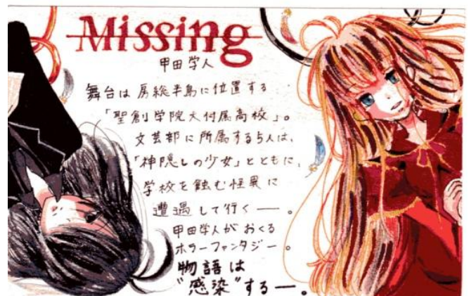
高校生の部 大賞作品