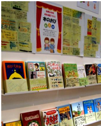
「本のおび」テーマブックのようす

ゼロ博士(0類) なんでも知っている ざつがく博士。 図書館についてもとても詳しい。