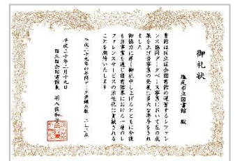
昨年度の礼状。本館総合カウンターに掲示しています。

市立図書館は、窓口等で受けた調べものを記録し「レファレンス協同データベース」に登録、公開しています。この度、運営する国立国会図書館から今年度のデータ登録件数が基準を超え