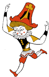
刊本作品No.55 ラムラム王 1964年

岡谷市出身で大正から昭和にかけて様々な芸術分野で活躍した武井武雄を紹介する企画展示とギャラリートークをイルフ童画館の協力により開催します。今も世界を魅了する武井ワールドに触れてください。