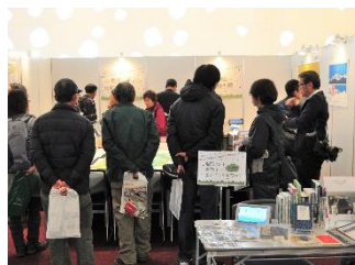
昨年の様子。多くの方にご来場いただきました。

会場ブースでは、図書館の3Dプリンターで作った山の立体地形図を展示するほか、山岳図書の紹介や子ども向けワークショップなどを行います。