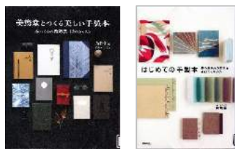
美篤堂の本もあります。

職人の手作業で製本や文具などを手掛ける伊那市の製本会社「美篤堂」による企画展示です。さまざまな手法で作られた本を紹介いたします。