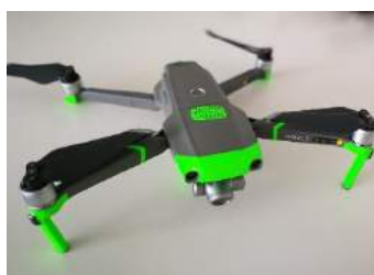
← 実際に使用するドローン