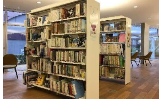
本館の「郷土塩尻」コーナー

市立図書館では、塩尻市に関するさまざまな資料を収集・保存し、どなたでも閲覧できるように整理しています。『塩尻市誌』や各地区誌、公民館報、地図などのほか、塩尻市について記述がある本は郷土資料として所蔵するよう努めています。さらに、市制施行 60周年を迎えた今年には、公民館と連携して塩尻の古写真の収集とデジタル化に取り組んできました。本館では、現在、デジタル化した写真の一部を展示公開しています。郷土の歩みを振り返る場としてぜひ図書館をご活用ください。