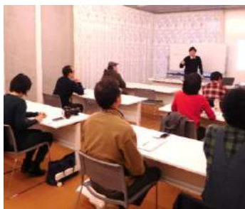
長野県よろず支援拠点と共催する「ビジネス情報相談会ミニセミナー」。講師は中小企業診断士です。