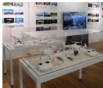
ドローン技術の進化の歴史に触れ、空撮映像を楽しむ企画展示。地元企業の協力で開きました。