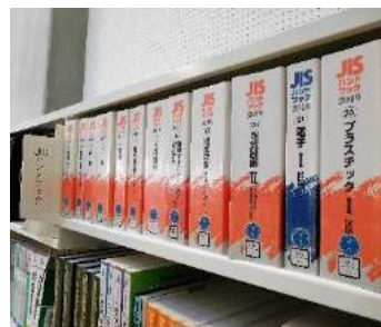
JISハンドブック。多数巻ある中から、必要なものを「塩尻市ものづくりアドバイザー」が選びました。