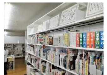
礼状は、本館総合カウンターに掲示します。

市立図書館は、窓口等で受けた調べものを記録し「レファレンス協同データベース」に登録、公開しています。この度、運営する国立国会図書館から今年度のデータ登録件数が基準を超えたことに対する礼状を受け取るようになりました。礼状を受け取るのは2013年度から7年連続です。