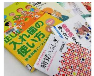
歯科医師の推薦本。松本歯科大学市民公開講座での出張図書館がきっかけで紹介してもらいました。