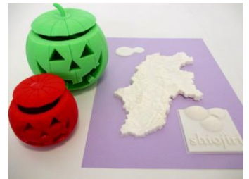
当館の出力サンプル

「自由にデザイン」 立体データは、個人でもコンピュータでデザインできます。 「早く・安く・簡単に作れる」 ものづくりに必要な試作。職人の手作業だと時間やお金がかかる場合もありますが、3Dプリンターなら早く安く簡単にできます。「アイデアがあっても作れなかった」個人や中小企業がものづくりに挑戦しやすくなりました。