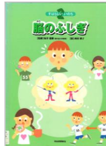
「すばらしいのち2 脳のふしぎ」 西村 博子／絵 坂井 建雄／監修 河出書房新社