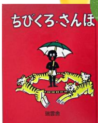
「ちびくろ・さんぽ」 ヘレン・バンナーマン／文 フランク・ドビアス／絵 光吉 夏弥／訳 瑞雲舎