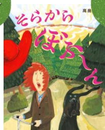
「そらからほふ〜ん」 高島 那生／作 くもん出版