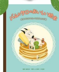
「パムとケロのおいしい絵本」 絵本のながのにとっておきレシピ集 八木 佳奈／料理・レシピ製作 島田 中が／監修 文楽堂