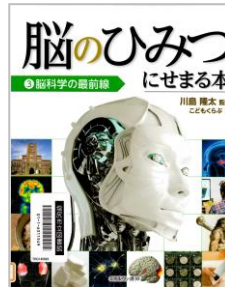
「脳のはみつにせまる本3 脳科学の最前線」 川島 隆太／監修 こどもくらぶ／編 ミネルヴァ書房