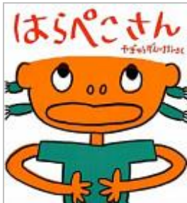
「はらぺこさん」 やぎゅう けんいちろう／さく 福音館書店