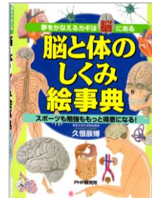
「脳と体のしくみ絵事典」 スポーツも勉強ももっと得意になる！ 久恒 辰博／著 PHP 研究所