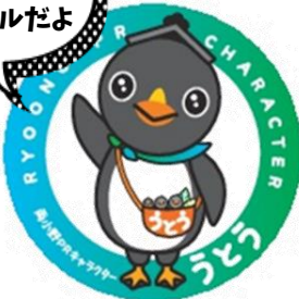
両小野地区 PRキャラクター うとう