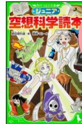
『ジュニア空想科学読本 1』 柳田 理科雄/作、藤嶋マル/絵 KADOKAWA