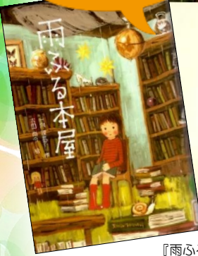
『雨ふる本屋』 日向 理恵子/作、吉田 尚令/絵 童心社

たとえば『雨ふる本屋』の奥付を見て みると……出版年月日は2008年 11月20日、つまり人間なら10才（小学 5年生）です！ほかに奥付には本を書いた 人や作った会社などの情報がのっています。