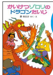
『かいけつソロリのドラゴンたいじ』 原 ゆたか/作・絵 ポプラ社