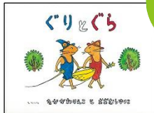
『ぐりとぐら』 中川 李枝子/作、大村百合子/絵 福音館書店