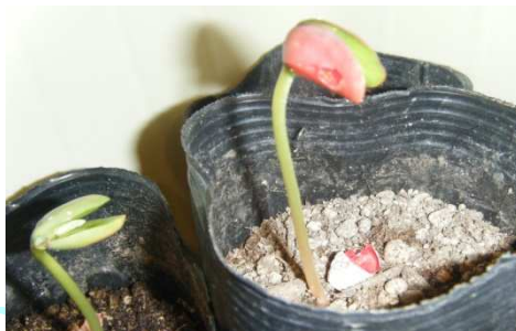
発芽しました(7月1日)