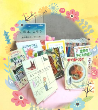
【書棚 16】 【児童テーマ ボックスA】

教科書の本と季節の本が入れかわりました。新しい教科書にのった本をチェックしよう！