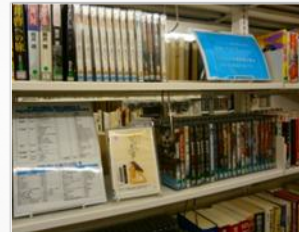
地元ゆかりの作品提供