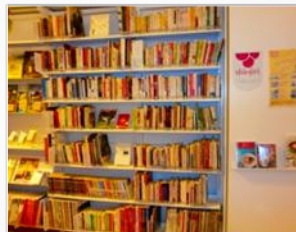
産業支援(ワインコーナー)