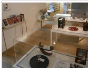
地元イベントの紹介