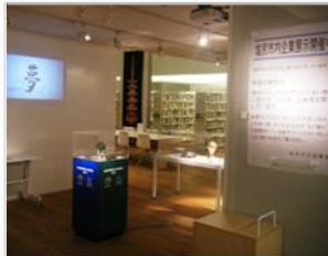
地元企業やお店を支援