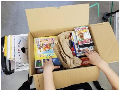
本屋さんから1週間分の本が届く。