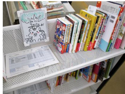
1週間かけて“見計らい”をする。