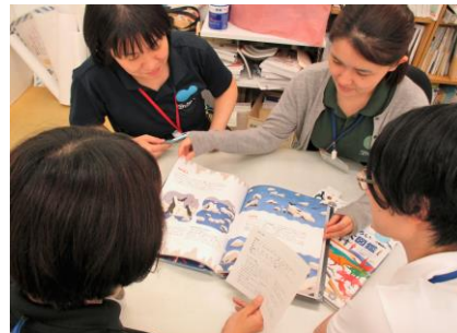
評価やコメントをみながら「選書会議」をします。