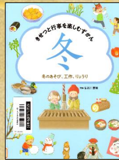
『きせつと行事を 楽しむずかん 冬』 長谷川康男/監修 岩崎書店