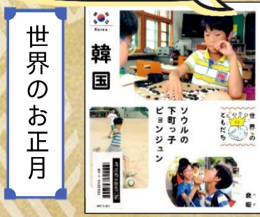
『世界のともだち 02 韓国』 衰昭/写真・文 偕成社