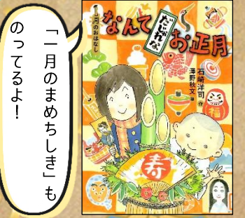
『なんてだじやれなお正月 1月のおはなし』 石崎洋司/作 澤野秋文/絵 講談社