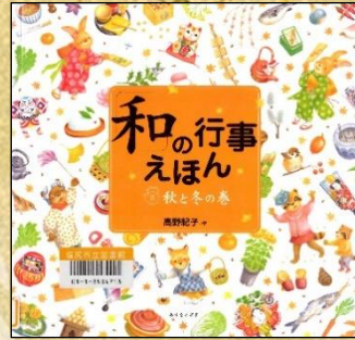
『和の行事えほん 2 秋と冬の巻』 高野紀子/作 あすなろ書房