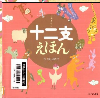
『十二支えほん』 谷山彩子/作 あすなろ書房