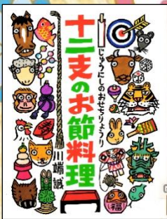
『十二支のお節料理』 川端誠/作 BL出版