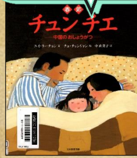
『チュンチエ 中国のおしょうがつ』 ユイリー・チョン/文 チュンチョンリヤン/絵 中由美子/訳 光村教育図書