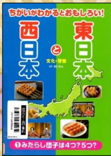
『ちがいがわかるとおもしろい! 東日本と西日本 1』 岡部敬史/編著 汐文社