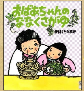
『おばあちゃんの ななくさがゆ』 野村たかあき/作・絵 佼成出版社