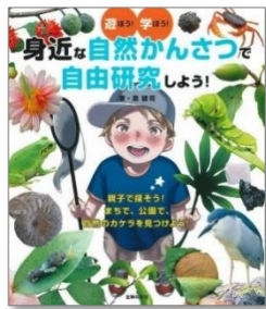
『身近な自然かんさつで 自由研究しよう！』 泉健司/文 (主婦の友社)