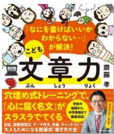
『なにを書けばいいかわからない ...が解決！子ども文章力』 齋藤孝/著 (KADOKAWA)