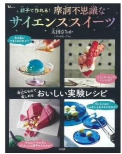
『親子で作れる！摩訶不思議な サイエンススイーツ』 太田 さちか/文 (宝島社)