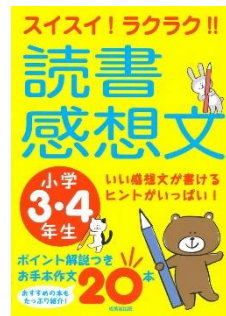
『スイスイ！ラクラク！！ 読書感想文小学3・4年生』 成美堂出版編集部/編 (成美堂出版)