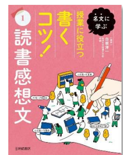
『名文に学ぶ授業に役立つ 書くコツ！①読書感想文』 白坂洋一/監修 (岩崎書店)