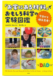
『「お家にある材料」でおもしろ 科学の実験図鑑』 セルゲイ・ウルバン/著 黒木 章人/訳 (原書房)