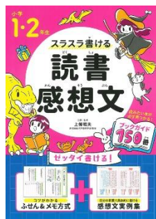
『スラスラ書ける読書感想文 小学1・2年生』 上條晴夫/企画・監修 (永岡書店)