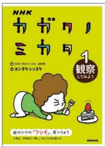
『NHK カガクノミカタ 1』 NHK「カガクノミカタ」制作班/編 ヨシタケシンスケ/絵 (NHK 出版)