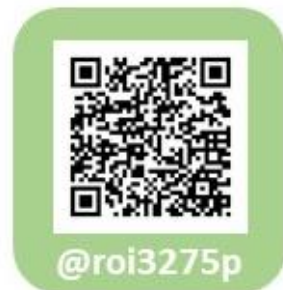
しおり部 LINE公式アカウント