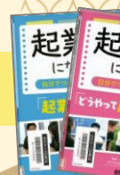
『起業家になりたい! ~自分でつくる未来の仕事~』 (2023) 保育社