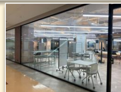
「core塩尻（ウィングロードビル2F）」