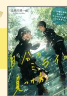
『自分のミライの見つけ方』 (2021) 見美川孝一郎/著 旬報社