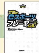
『プロのeスポーツプレイヤーになる!!』 (2019) 河出書房新社