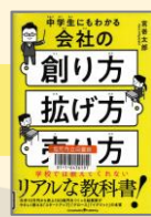
『中学生にもわかる会社の創り方・拡げ方・売り方』 (2021) 児美川孝一郎/著 旬報社