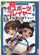
『eスポーツプレイヤーになるには?』 (2021) 金の星社