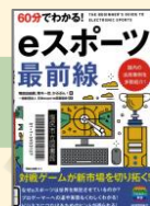
『60分でわかる! eスポーツ最前線』 (2020) 技術評論社