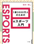
『1億3000万人のためのeスポーツ入門』 (2019) 但木一真/編 NTT出版