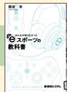
『みんなが知りたかった最新eスポーツの教科書』 (2019) 岡安学/著 秀和システム