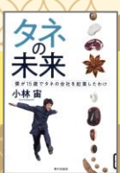
『タネの未来』 (2019) 小林宙/著 家の光協会