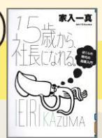
『15歳から、社長になれる。』 (2013) 家入一真/著 イースト・プレス